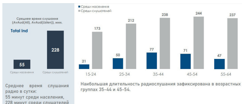
Рис. 2. Срэдняя длітельность слушанья, мин.

На рысунке 2 прэдаставлены паказателі сэраднего времэні радыя-прослушыванья как в разрэзе аудыторыі радыя, так і в разрэзе вьсего гарадского насельня, в каторое вклучэны рэспандэнтў, каторыя не з'яўляюцца слухачамі радыястанцыі.