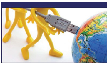
От журналистики - к инноватике Теория и практика

В издании отмечается, что в условиях глобализации информационного пространства важнейшим инструментом продвижения в массовой сознание идей межкультурной и межконфессиональной толерантности, международного сотрудничества и диалога культур становится международная журналистика, базирующаяся на принципах объективности, достоверности и добросовестности. А так как необходимым условием успешной и эффективной деятельности современного общества становится научное сопровождение процессов его развития, то на первый план сегодня выходят вопросы научного осмысления реалий и перспектив международной журналистики, поиска и нахождения путей ее эффективного взаимодействия с другими факторами, влияющими на формирование облика информационного общества XXI века. Какие же действия надо предпринимать сейчас, чтобы международная журналистика смогла достичь высокой степени актуализации своих междисциплинарных научно-публицистических исследований? Ответ – в данной работе.