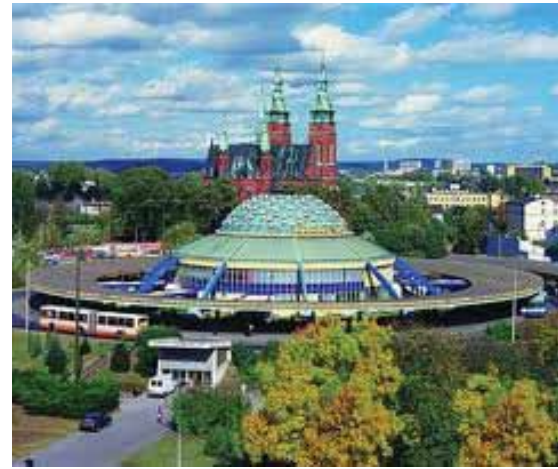
На снимке: Кельце – центр Свентокшистского воеводства.

Свентокшистское воеводство является регионом, содействующим налаживанию международных контактов равным образом в сферах экономической, политической и образовательной. Этому способствует: выгодное расположение и близость, как уже отмечалось, крупных городских агломераций – Варшавы, Кракова, Лодзи, Шлэнска, - присутствие целого ряда международных конвенций, действующих в регионе, – RR Donneley (США), MAN (Германия), NSK Bearings (Япония), Lafarge (Франция); хорошо подготовленные территории под инвестиции промышленного и услугового характера; второй по величине в Польше ярмарочный центр; высококвалифицированные кадры работников; богатые промышленные традиции; сравнительно более низкая в масштабах страны стоимость рабочей силы; молодые, хорошо образованные люди, знающие иностранные языки (45 тысяч студентов); хорошо развитая учебная база; природные и климатические ценности. Активность и международное сотрудничество органов самоуправления Свентокшистского воеводства являются важнейшими инструментами создания современного и гармоничного развития воеводства во всех областях, в том числе образования и науки, экономики и инноваций, региональной энергетической политики, здоровья и социальной политики, охраны и