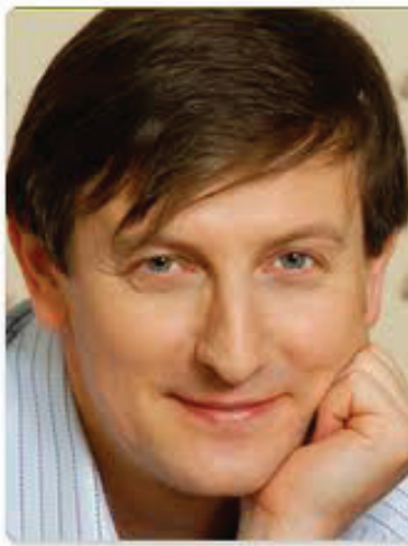
Опасное копирование рискованного фискализма

Проект закона о бюджете Беларуси на 2014 год может составить группа студентов-программистов с базовыми знаниями экономики. И гораздо дешевле будет, чем затраты на сегодняшний Минфин. Надо лишь этой группе молодых талантов дать инструкции из Администрации президента, указать, кому и сколько прибавить, откуда можно изымать, какие темпы роста ВВП, курс Br/$, инфляцию брать в качестве базовых – и вперед. Расчёты без проблем сделает господин Excel. Фискальную политику Беларуси нельзя назвать циклической или контрциклической. Она стала бухгалтерско-кассовой: собери налоги с разных коммерческих структур, получи от начальства список затрат, сделай заначку для «своих» – и трать, во имя валового роста ВВП и за упокой рыночной экономики.