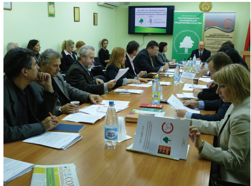
Круглый стол «Проблема трудовых ресурсов для бизнеса Беларуси и пути ее решения». г. Минск, 25 сентября 2013 года.