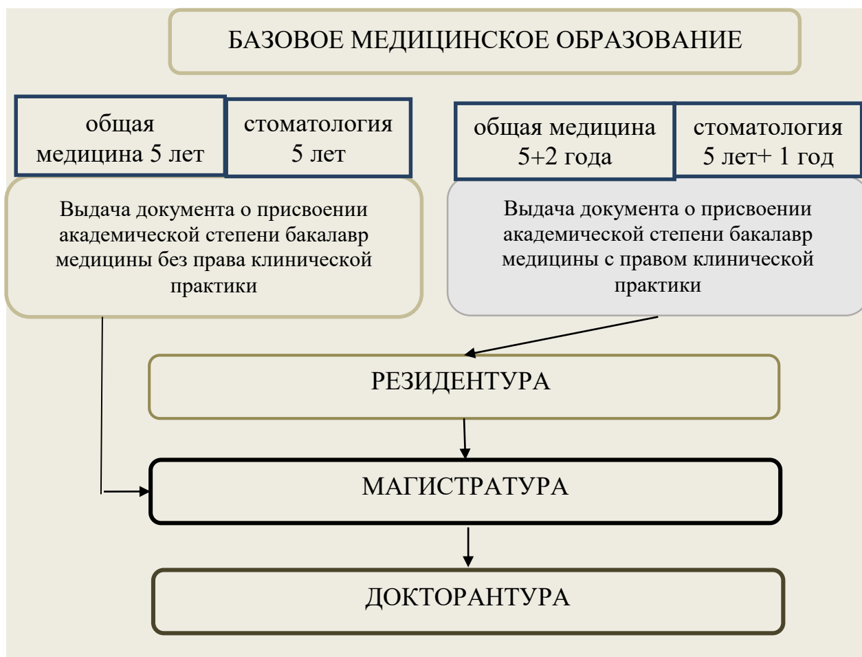
Рисунок 1 – Структура подготовки медицинских и фармацевтических кадров в Республике Казахстан

Далее начинается многоуровневая последипломная программа обучения. Задачей второго этапа-последипломного образования-является необходимое завершение подготовки специалиста (завершение условное, так как медицинское образование продолжается всю жизнь), способного компетентно, квалифицированно и, главное, самостоятельно оказывать лечебно-профилактическую помощь, на достаточном уровне решать все профессиональные задачи в рамках избранной специальности, о чем должен свидетельствовать получаемый на этом этапе сертификат специалиста.