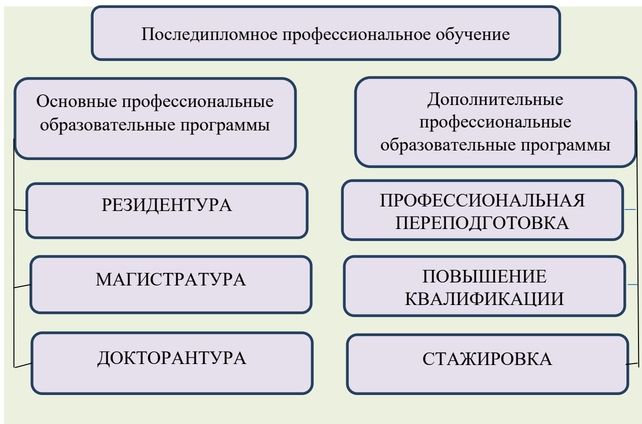
Рисунок 2 – После дипломное профессиональное образование в медицине