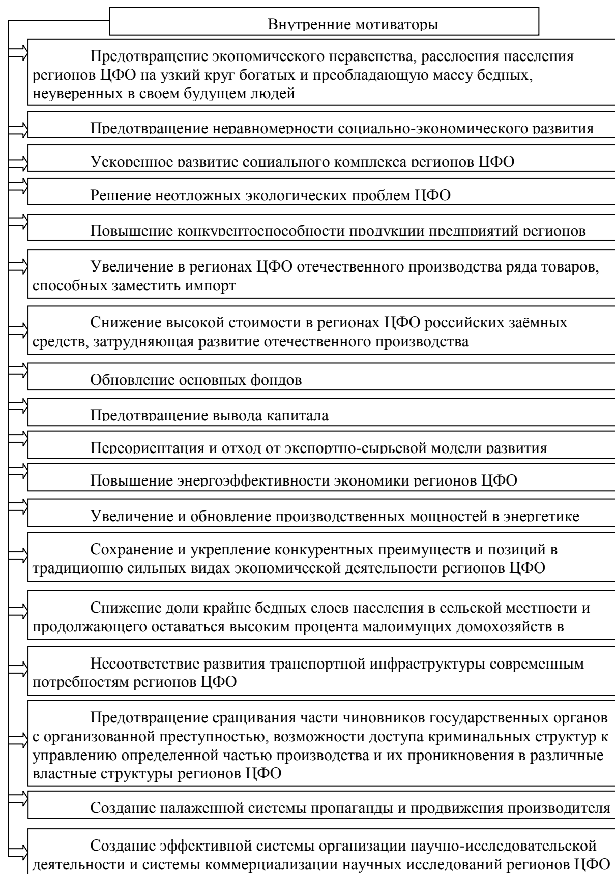
Рисунок 1 – Внутренние мотиваторы расширения внешнеэкономических связей регионов ЦФО со странами Евразийского экономического союза в условиях процесса глобализации

колыбельные песни, так как сила воздействия жанровой формы фольклорного происхождения, которая имеет обязательные магические коннотации очень велика [1, с. 8]. В большинстве таких песен перед ребенком разворачивается перспектива его будущей самостоятельной взрослой жизни, где он создаст собственную семью, будет работать, воспитывать своих детей. То есть, определяется структура социального пространства, в котором будущий гражданин найдет свое место, а также нравственные идеалы взаимоотношений со старшими и младшими товарищами. Так строится система целей и задач жизнедеятельности ребенка. Поэтому указанные произведения в условиях тоталитарной культуры имели яркий пропагандистский контекст.