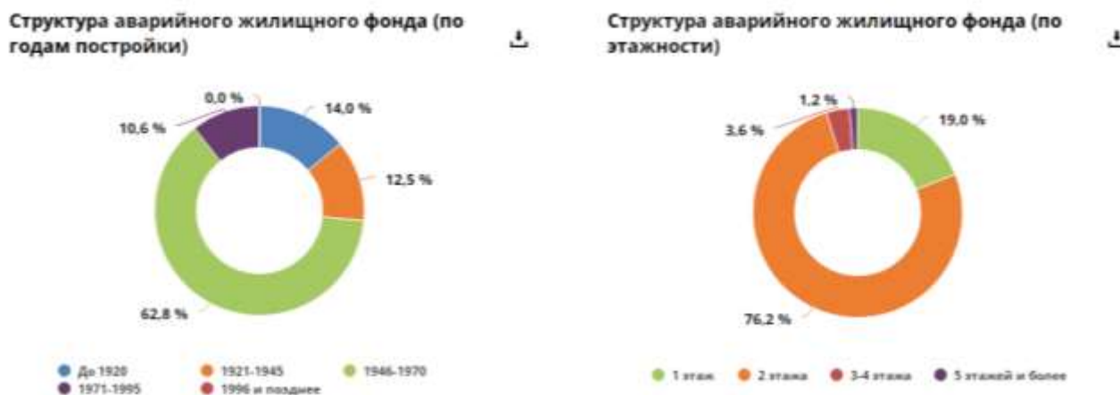
Рисунок 1 - Данные сайта Реформа ЖКХ по Тверской области на 20.06.2022 г. 6

Из приведенных выше данных можно сделать вывод, что на территории Тверской области большую часть аварийного фонда составляют одноэтажные и двухэтажные многоквартирные дома старой постройки. Обычно для таких домов выделяли довольно большие земельные участки, которые позволяли устанавливать на них дровяники и сараи для хранения дров в связи с преимущественно печным отоплением таких домов. Собственники со временем приспособили эту территорию для посадки урожая в виде небольших огородов, а также установки теплиц, возведения красивой дворовой территории, постройки гаражей для личного транспорта и других способов использования такого земельного участка. При переселении земельный участок, располагаемый под аварийным жильем, переходит в собственность государству, а жителей переселяют в новые квартиры в больших многоквартирных домах, где территорию используют для общедомовых нужд, что часто вызывает массу вопросов у граждан, которые не хотят расставаться со своим огородом или уютным двориком. Данное обстоятельство несомненно создает трудности и является одной из основных проблем в использовании земельных участков при реализации программы переселения из аварийного жилья.