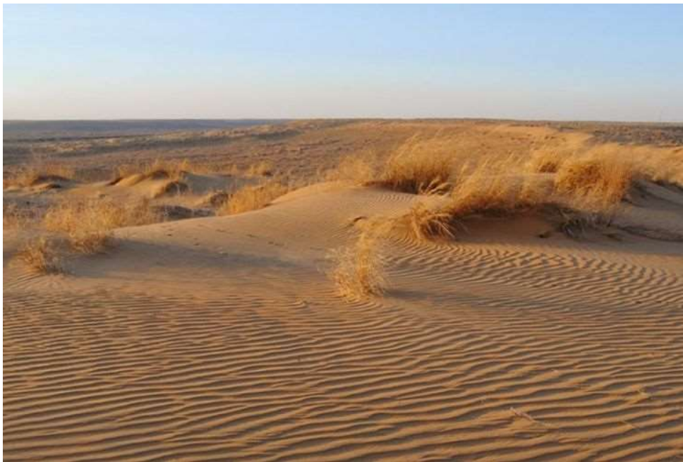
Сурет 2. Шөл зонасының ландшафттары [8]

Ұлытаудан шығысқа қарай Сарысу–Теңіз провинциясы орналасқан. Шөлейтті жазықты ұсақ шоқылы болып келетін ол палеозой қалқанының Сарысу теңіз күмбезді көтеріліміне ұштасып жатыр. Оны неоген төрттік қозғалыстар қамтыған. Провинцияның ландшафт құрылымында ұсақ шоқылы сортаңды шөл дала кешендері мен аралдық аласа таулар мен грабен түріндегі ежелгі және қазіргі аңғарлармен ұштасқан жертөре аридті денудациялық жазықтар басым. Ұсақ шоқылардың абсолюттік биіктігі 500-600 м. Аласа тауларда 600-760 м, жертөре жазықтықтарда 450-500 м. Провинцияның оңтүстігінде Сарысу өзенінің ұлан байтақ аңғары жатыр. Ол Сарысу тектоникалық ойысында орналасқан.