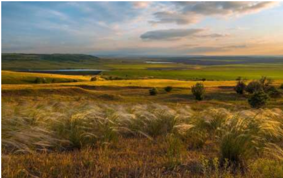
Сурет 1. Дала зонасының ландшафттары [7]

Дала зонасының ландшафт құрылысының негізін элливиальды топтың ландшафттылары құрайды, олар өзенаралық жазықтықтарға, ұсақ шоқыларға, аралдық аласа тауларға ұштасқан және зонаша ауданының шамамен 67,4% алып жатыр. Көлемді аудандар (30,2 мың км 2 немесе 32,6%) ежелгі және қазіргі өзен аңғарлары мен көл қазаншұңқырларының жартылай гидроморфты және гидроморфты ландшафттыларға келеді.