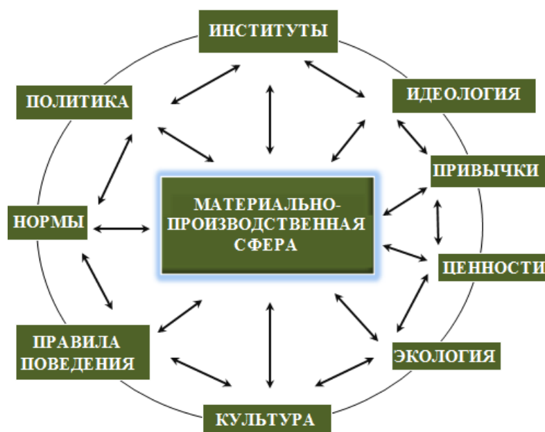
Рис. 1. Структура социальной системы материально-технологической среды

Для социальной системы материально-технологической среды характерны все черты, приписываемые любым системам. Однако социальные системы еще имеют собственные характеристики, которые объясняются спецификой самих социальных субъектов, где главной характеристикой социума является не структура или эффективность производства условий существования, а система ценностей, воплощенных в его культуре.