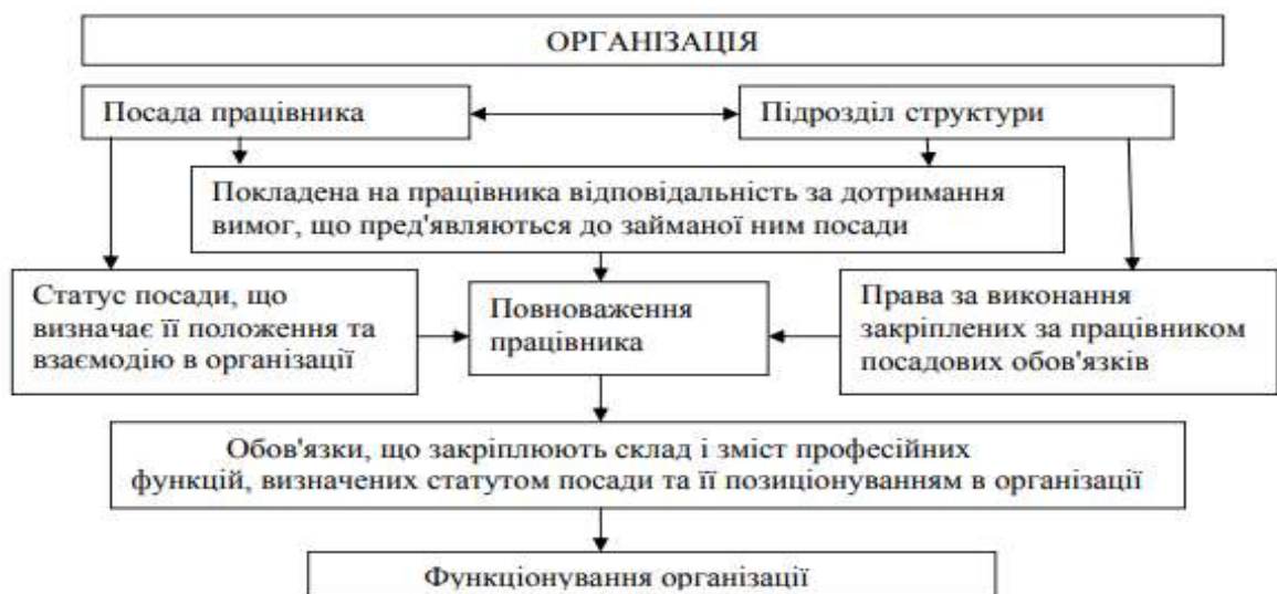
Рис. 1 Формування повноважень співробітника організації

У цілому місце і роль кожної з цих складових у формуванні реальних повноважень співробітника організації можна представити наступним чином (рис..1.).