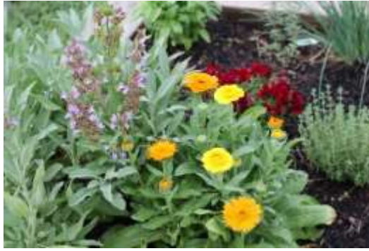
Рисунок 1. Низкорослые сорта

Низкорослые сорта используют для оформления бордюров. Они прекрасно смотрятся на клумбах с голубыми декоративными цветами- васильками. Календула также отлично смотрится в горшках для патио и смешанных бордюрах. Календулу можно посадить в любом саду и она прекрасно смотрится как в одиночной посадке, так и в сочетании с другими цветами [4].