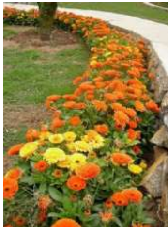
Рисунок 2. Calendula officinalis

Низкорослые сорта используют для оформления бордюров. Они прекрасно смотрятся на клумбах с голубыми декоративными цветами- васильками. Календула также отлично смотрится в горшках для патио и смешанных бордюрах. Календулу можно посадить в любом саду и она прекрасно смотрится как в одиночной посадке, так и в сочетании с другими цветами [4].