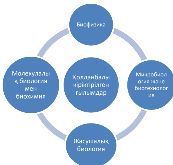
2 сурет -Қолданбалы кіріктірілген ғылымдар