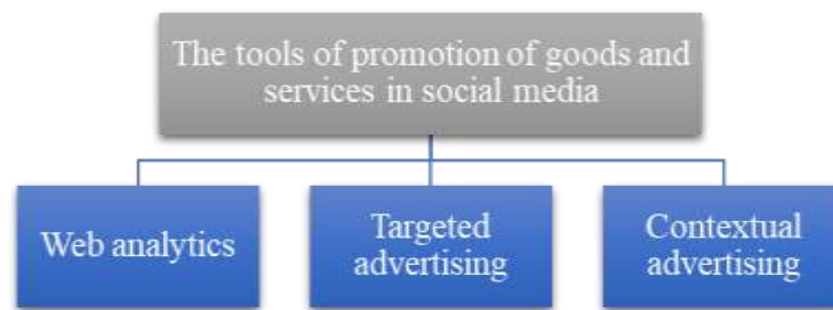
Figure. Tools for promotion of goods and services in social media [1-3]

It's important to mention that web analytics allows business to monitor the whole path of an online buyers from the first viewing of advertising content to the purchase of promoted goods or services. It helps to analyze the received information and make right conclusions about the necessity of using certain methods of advertising, how effectively they work to attract the attention of a potential online buyer. In addition, it greatly simplifies the collection of information about the client. In future it will adjust the company's development strategy in a more profitable direction. This information is the key to the right targeting, which allows many social media for business to convey a certain advertising message to those of them who are the target buyers.